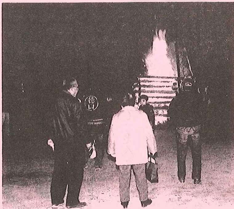
道祖神火祭り (どんどび焼き)