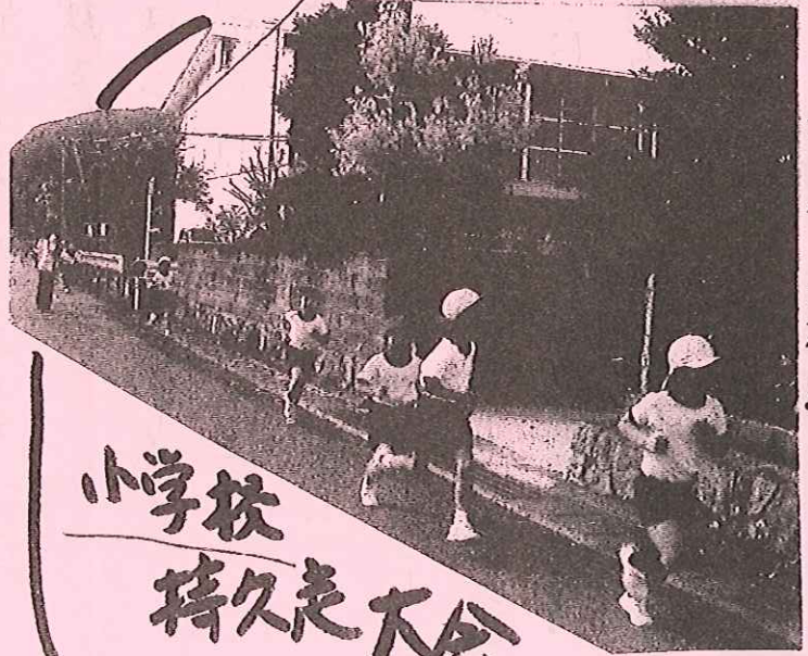
小学校 持久走大会

平成23年12月2日(金) 今年の持久走大会は、天候に 恵まれました。 児童は、休み時間に走り込んで 成果を發揮し、自己ベストと 出そうと力走しました。 沿道の応援の声もきくと、 カになったことでした。 ガンバッタネ!!