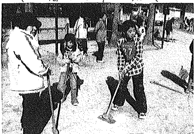
建国記念の日 式典・協賛行事

立春すぎの余寒つづく中、この日はおだやかに晴れ、百名弱もの参加があり、協賛行事のクラブドゴルフでは予想以上の人出に、主催者はチーム縮成の変更を余儀なくされるなど、うれしい悲鳴を上げていました。