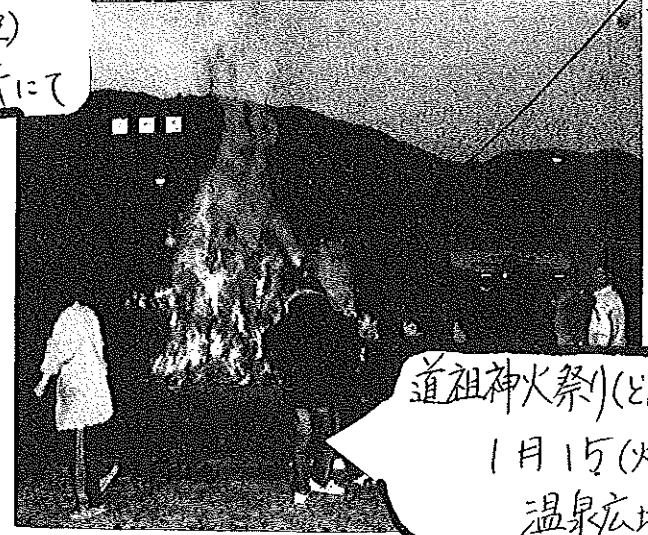
道祖神火祭(どんど焼き) 1月15(火) 温泉広場にて