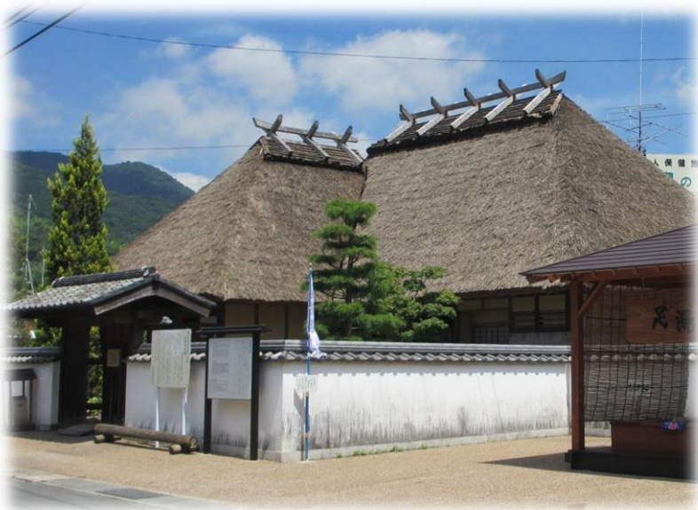
写真 県文化財・山田家本屋