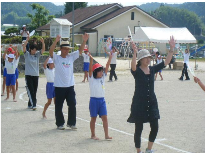
(みんなで参加しました!!熊毛町音頭)