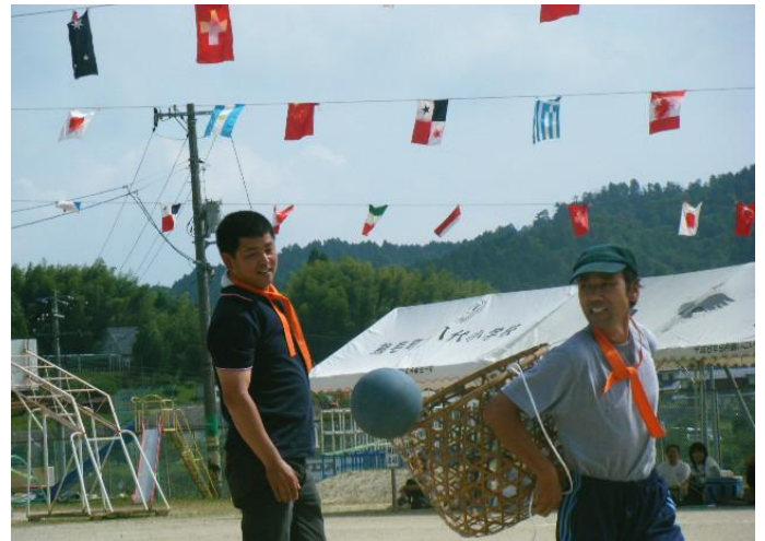
(なかなか入らないんだよなあ…。)