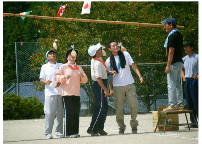
(誰が最初に取りれるかな?パン食い競争)