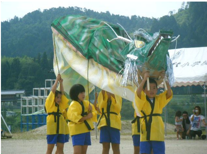
(龍神太鼓かっこ良く決まったね!!)