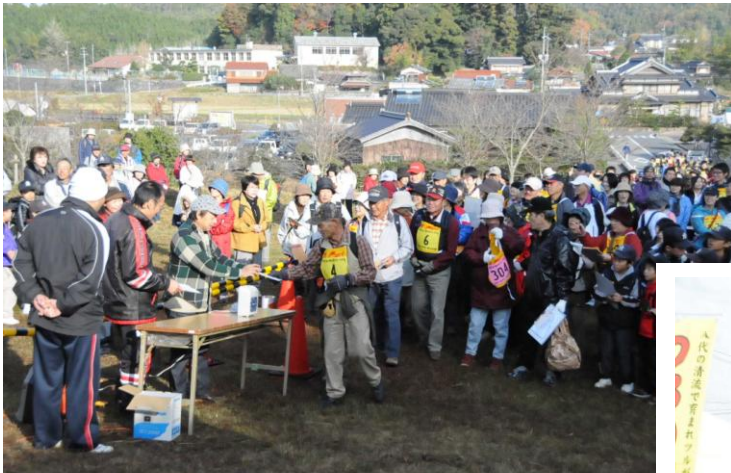
(ウオークラリースタート時)