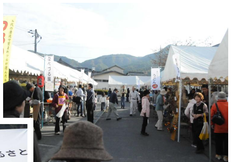
(観光収穫祭の様子)