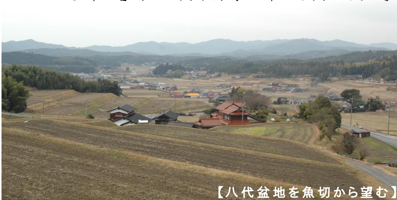
【八代盆地を魚切から望む】