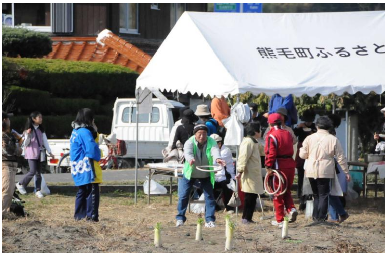
(イベント畑の様子)

11月23日に毎年恒例のくまげ鶴の里ウオーク大会と八代観光収穫祭が開催されました。今年は例年よりウオークの参加者が少なかったのですが、それでも約600名の方に参加して頂きました。観光収穫祭には、多くのお客さんにご来場いただき、八代の初冬の味覚を堪能して頂けたと思います。この他にも交流センター近くのイベント畑では大根を使った輪投げゲームが行われたり、ふるふき大根の無料配布が行われました。