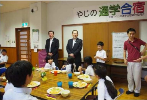
↓もらい湯家庭の方とも仲良く