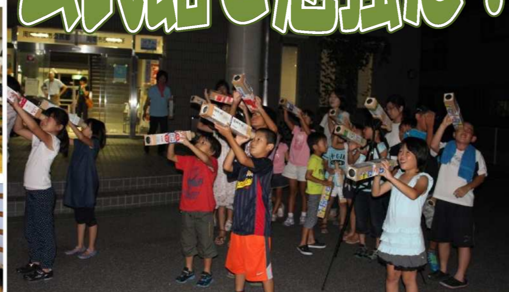
★みんなで月の観察！牛乳パックでもよく見えたよ！