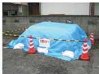
〈旧伊賀バス回転場〉 土のう約250袋

また、各自におかれましては、いざという時に迅速な対応や行動ができるよう自宅・勤務先からの避難ルートや避難場所の確認など予備知識を頭に入れ、常に防災意識を持った生活をするようにしましょう。