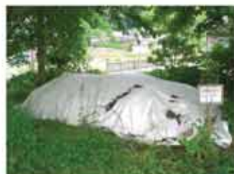
〈的場児童公園〉 土のう約400袋