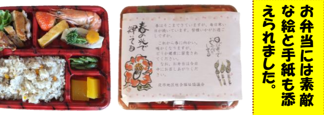
お弁当には素敵な絵と手紙も添えられました。