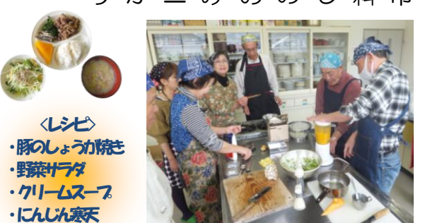
レシピ ・豚のしょうが焼き ・野菜チヂミ ・クリームスープ ・にんじん寒天

2月26日（火）夜市公民館で第30回男性料理教室を開催しました。料理同好会女性の方も含め、約15名での開催となった今回もみんな楽しくコミュニケーションを図りながらおいしい料理を作りました。