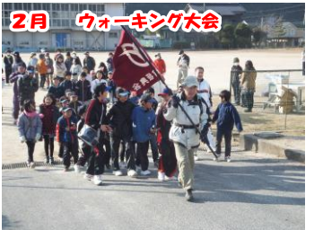
2月 ウォーキング大会 今回も約100名の参加者で楽しく歩きました。