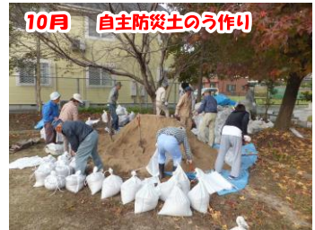
10月 自主防災士のう作り 自主防災組織で災害用の土のう250袋を作りました。