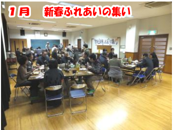
1月 新春ふれあいの集い 新年恒例の集いで参加者同士懇親を深めました。