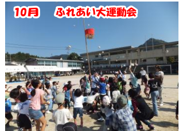
10月 ふれあい大運動会 24年度は2年に1度の地区運動会が開催されました。