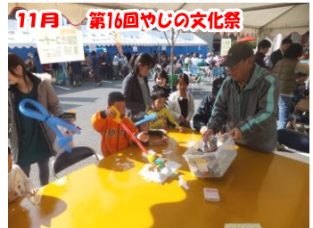
11月 第16回やじの文化祭 今回の文化祭も多くの来場者で賑わいました。