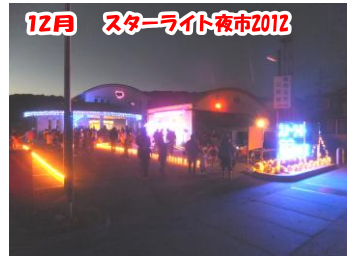
12月 スターライト夜市2012 1万球を超える電飾で夜市の夜が彩られました。