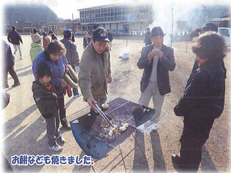
お餅なども焼きました。

1月12日(土)夜市小学校グラウンドで、恒例の「どんど焼き」が行われました。 これは「コミュニティ推進協議会」の主催により行われたもので、正月のお飾りや書初めなどを持ち寄り、焼きたてのぜんざいなど、今年は無病息災を祈念しました。 また、この日はどんど焼きのほか、お餅を焼いたり、ぜんざいの接待が行われたりと、正月最後のイベントに参加者みんなで楽しみました。