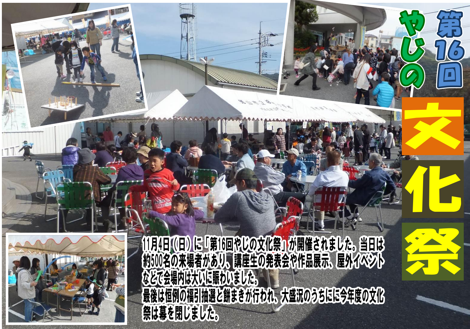
11月4日(日)に「第16回やじの文化祭」が開催されました。当日は約500名の来場者があり、講座生の発表会や作品展示、屋外イベントなどで会場は大いに賑わいました。最後は恒例の福引抽選と餅まきが行われ、大盛況のうちに今年度の文化祭は幕を閉じました。

パソコンでご覧になる場合は → 『周南市コミュニティ推進協議会』ホームページ ( http://gokan-furusato.org/community/community.html ) (カラーでご覧になれます)