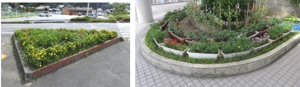
(右)支所入口 (下)県道入口

これは、地区内の花づくりの会のみなさんが種から育苗されたものです。是非ご鑑賞下さい。