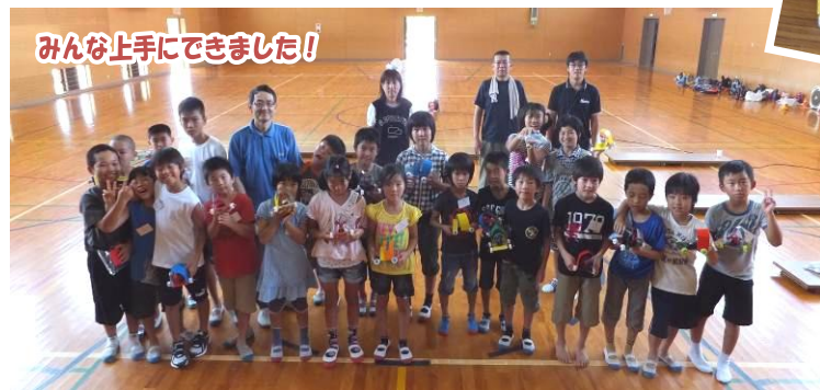
みんな上手にできました!