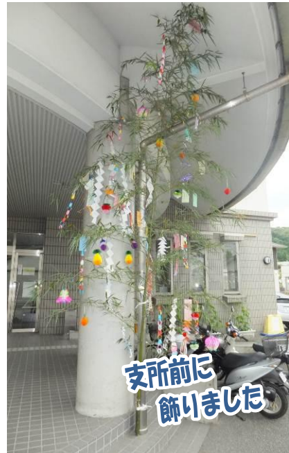
支所前に飾りました