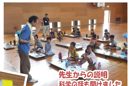
先生からの説明 科学の話も聞きました