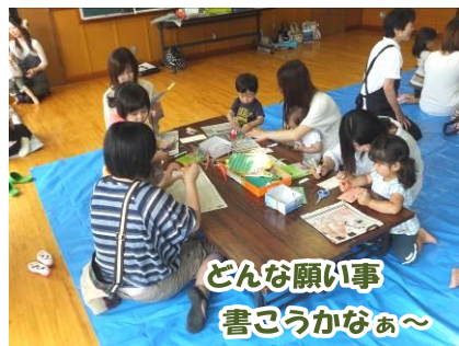
どんな願い事書こうかなあ～

6月26日(火)サークルゆりかごが開催されました。 これは、母子保健推進員さんを中心に未就園児親子を対象として開催されたもので、今回は七夕の飾りつけをしました。 当日は民生委員児童委員協議会の方々もボランティアで参加され、約30名の親子が、短冊に自分のことや家族のことなど、様々な願い事を書きました。 思いを込めて書いたみなさんの願い事がかなうといいですね。