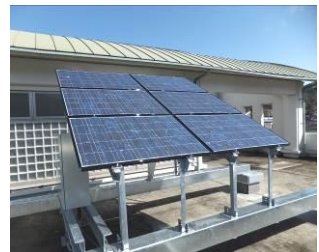
公民館屋上に設置

この度、夜市公民館に太陽光発電設備を設置しました。これは、環境に配慮したソーラー型の設備として整備したもので、日常の軽微な電力や、非常時の電力として活用します。