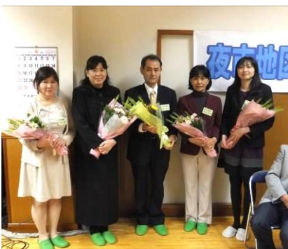
転任・着任された方々。 お世話になりました&よろしくお祈りします。