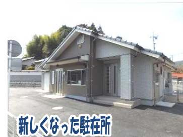
新しくなった駐在所

新しくなった駐在所は旧駐在所の約1.4倍の広さとなり、来訪者の利便性の向上として3台分の駐車場の整備やバリアフリー化もされました。