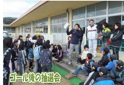
ゴール後の抽選会