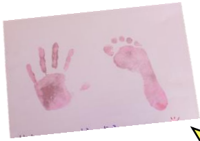
可愛い手型・足型がとれました。