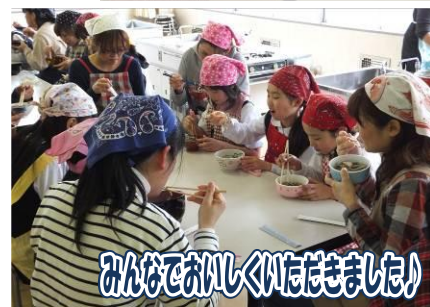
みんなでおしくいただきました