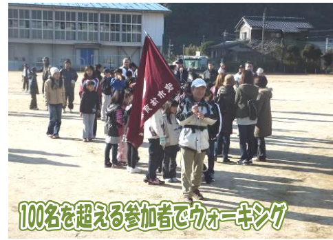
100名を超える参加者でウォーキング

この大会は、速さを競うものではなく、みんなで楽しくウォーキングすることを目的としたもので、当日は100名を超える参加があり、夜市小をスタートし、伊賀の猿尾谷遊歩道を経由し、夜市小に戻ってくるコース約6kmのウォーキングをしました。無事に戻ってきた後は、恒例の抽選会も行われ、参加者みなで楽しい一日を過ごしました。