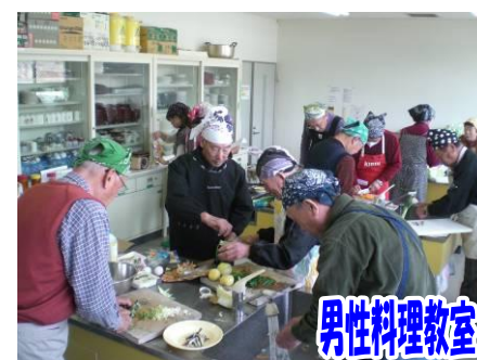
男性料理教室 年4回開催の男性料理教室(公民館学級)