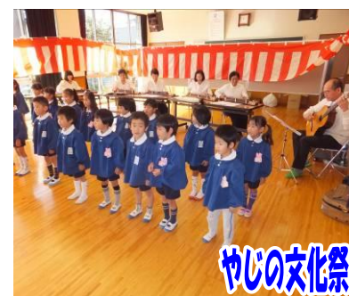
やじの文化祭 やじの文化祭では日頃の練習の成果を発表しました。