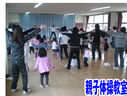
親子体操教室 幼稚園児・未就園児を対象とした親子体操教室(公民館学級)