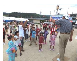
▲実行委員長とのじゃんけん大会。子どもも大人も一緒になって参加しました。