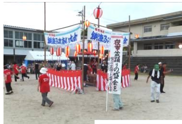
▲▲「福川の盆踊りを盛りあげる会」方によるさんさ踊り等の披露