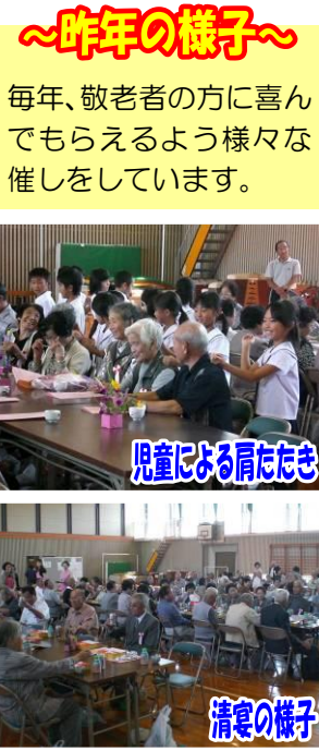
~昨年の様子~ 毎年、敬老者の方に喜んでもらえるよう様々な催しをしています。

日時 9月30日(金) 11時~13時 場所 夜市小学校体育館 対象者 夜市地区在住の75歳以上の方 (昭和12年1月1日以前に生まれた方) ※対象者には別途書面等で案内 主催 夜市地区社会福祉協議会