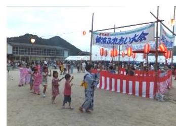
▲夜市四季小唄踊り。この日のために練習してきた小学生も上手に踊れました。