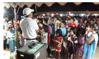
▲大会最後を締めくくる福引抽選会。発表される度にみなさん大興奮でした。