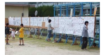
▲小学生が書いてくれたポスターを掲示。多くの方が足を止めて見ておられました。