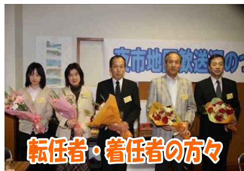
転任者・着任者の方々