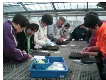
〈農大での研修の様子〉