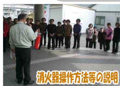
消火器操作方法等の説明

2月25日(金)に夜市公民館で地区住民約20名の方と消防訓練を実施しました。 この日は、2階調理室から出火したことを想定し、消防本部への通報訓練、屋外への避難訓練等を行いました。 参加者のみなさんは真剣に訓練に取り組み、大変有意義な消防訓練となりました。