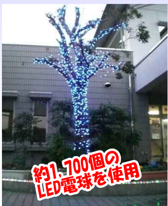
約1,700個のLED電球を使用

12月10日(金) 夜市公民館で「紙で作るクリスマスツリー」を開催。すまいるクラブと公民館の共催事業で約30名の参加者が力を合わせ、立派な紙のクリスマスツリーを作りました。