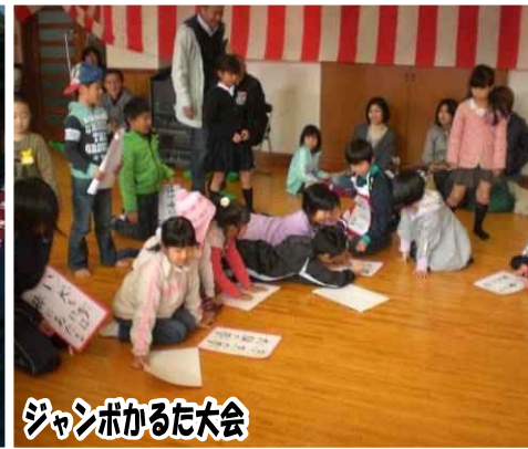
ジャンボかるた大会