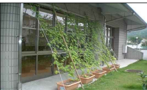
昨年度の「緑のカーテン」です。 …今年こそは!!