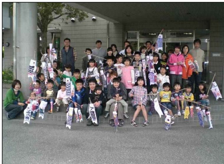
〈自分で作った鯉のぼりを手に全員で記念撮影〉

4月24日(土)に夜市公民館にて「親子で鯉のぼりを作ろう」を開催しました。当日は約50人の参加者があり、それぞれ思うままに色づけ等をして、個性豊かなオリジナルの鯉のぼりを作りました。子ども達は、自分が作った鯉のぼりを外で風になびかせ、楽しんでいました。最後は、みんなでカレーライスを食べ、記念撮影をして閉会しました。当日までの準備、当日の運営に従事されたボランティアスタッフのみなさんお疲れ様でした。