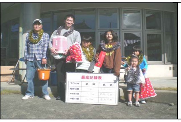
← 見事入賞者された方々