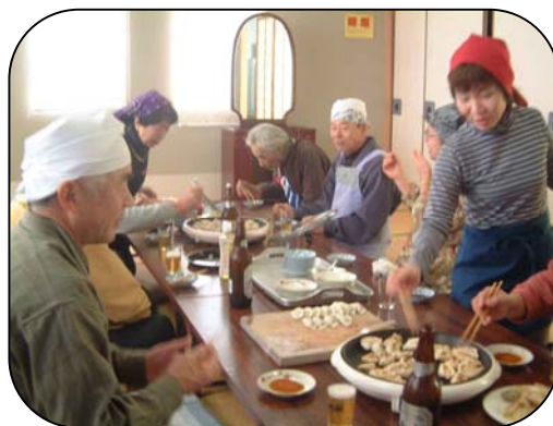
ギョーザの試食会