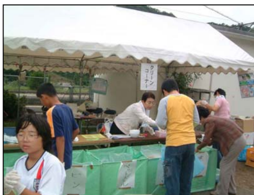
クリーンコーナーでは約60名の小中学生が 会場内のゴミの分別に協力してくれました。