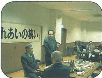
新春ふれあいの集い 夜市公民館にて

今回初めてコミュニティ推進協議会 の主催で夜市小学校グラウンドで行わ れました。 約六十名の方が、お飾りなどを持 つてこられました。コミュニティ役員に よる『おしるこ』のサービスも行われ ました。