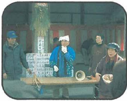
やじうままつり せり市の風景