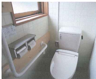
高瀬集会所のトイレ