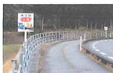
長野、平木、梶尾に設置

2月17日(火)ドライバーへの走行注意看板を地域の方々の協力で設置することができました。4月からは、小学校に6名の新一年生が入学予定です。地域全体で見守ってまいります。