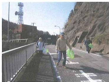
ゴミ袋を片手に環境美化活動。気軽に参加しませんか?