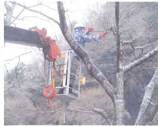
共同産業(株)によるテングス病治療作業の様子

新平ヶ原公園の桜がカビの一種テングス病にかかり、樹勢が弱り、やがて枯死するため、共同産業(株)が、無償で病気の枝を切ったり、傷口に塗布剤を塗ったりして、病気の拡大を防ぐ治療をされました。