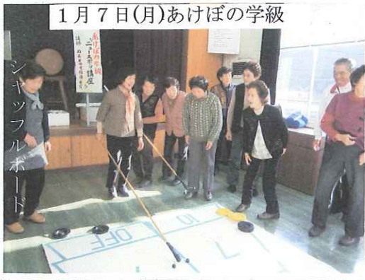
1月7日(月)あけぼの学級

とき 2月8日(金) 9時 ところ 防府・阿知須方面 内容 三丁尻塩田公園 会費 2,000円(昼食代他) 阿知須さげもん