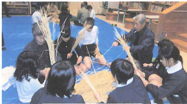
三世代交流しめ縄作り

公民館に飾っておりますお花は生花教室、重ね餅は和田ライスセンターさんよりご提供いただきました。いつも有難うございます。