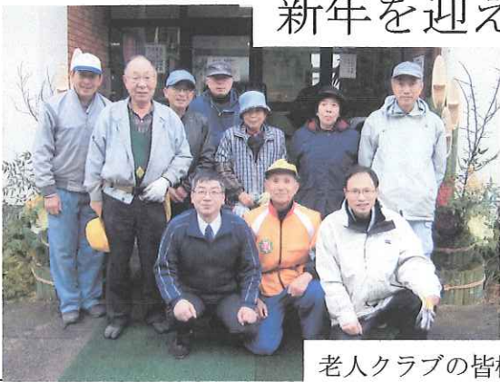
老人クラブの皆様による門松作り