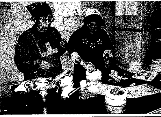
チャレンジセミナー 12月のケーキづくりの様子