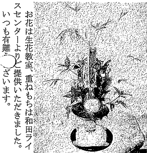
老人クラブの皆様による門松づくり12/22

お花は生花教室、重ねもちは和田ライ スセンターよりご提供いただきました。 いつも有難うございます。