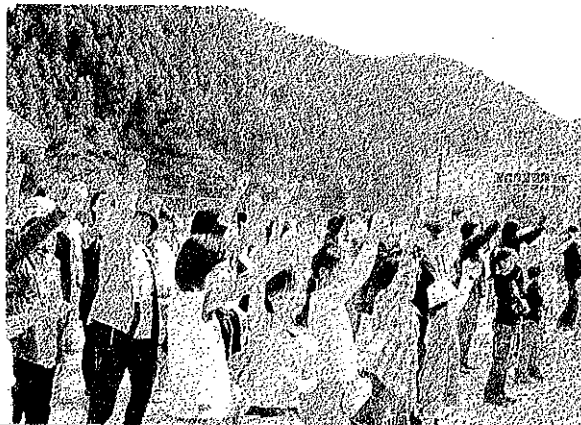
ジャンボじゃんけん大会