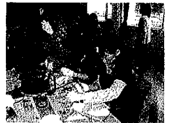
3月5日開催のチャレンジセミナー 「スタンドグラスに挑戦」の様子です

来年度もよろしくお祈りします。 和田公民館の講座、教室などは引き続き内容を充実して実施します。今後「れい明」などで紹介してまいりますので、お気軽にご参加ください。