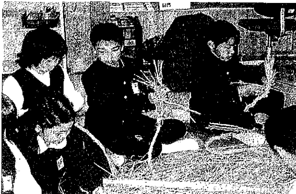
三世代交流(しめ縄づくり)12・14