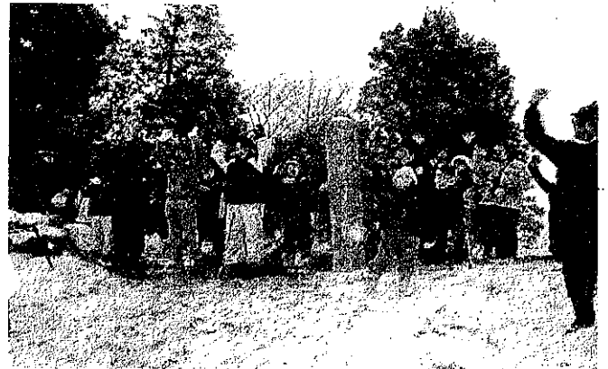
ご来光を迎えて万歳三唱(平成20年元旦)