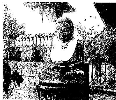
伝福寺境内のお地藏様

今なれも、名もなき聖を弔つ た地藏さまは、ひっそりと地区 の人に見守られ、子供達に愛さ れています。 (郷土史家 原田義明)