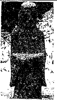
大谷の道祖神 (郷土史家 原田義明)