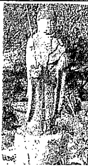
和田地区で一番古い三波寺のお地藏さん