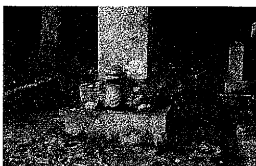
墓にしては珍しい亀跌

日時 9月4日(日) 19:00~21:00 会場 和田中体育館 対象 どなたでも 内容 ソフトバレーボール 主催 和田レクリエーションスポーツ推進委員会