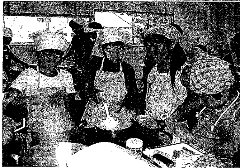
ひとりできる料理教室

和田公民館では、学級、親子ふれあい教室、各種講習会など、地域の生涯学習を展開しています。