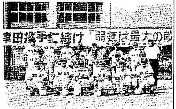
和田中学校野球部

第十回「津田投手杯交流野球大会」が七月十八日に、行われました。第一試合の、和田中対島地中の対戦は、両エースの好投で一点を争う白熱したゲームが展開されました。続く和田、島地、富田西、夜市の各スポーツのゲームも熱戦が続きまし