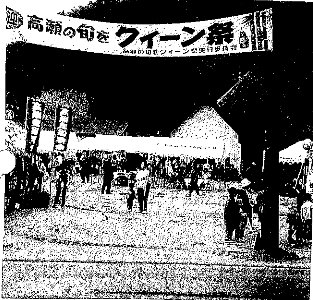
☆☆☆昨年のクィーン祭の風景☆☆☆