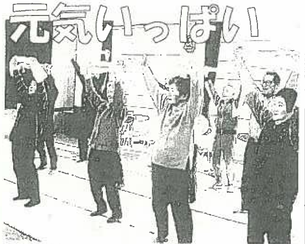
▲3月8日開催のあけぼの学級「健康体操」

来年度もよろしくお願ひします。 和田公民館の講座、教室などは引き続き内容を充実して実施します。今後「れい明」などで紹介してまいりますので、お気軽にご参加ください。