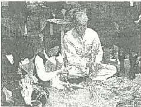
三世代交流(しめ縄づくり)12・16