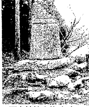
河内神社由緒碑(升谷)

今、埵の畑の山の中に「宝篋印塔(ほうきょういんとう)」の古いお墓があり、また升谷の河内神社の境内にある「河内神社由緒碑」などこれらのものを見るとき、考えさせられる貴重な史跡なのです。