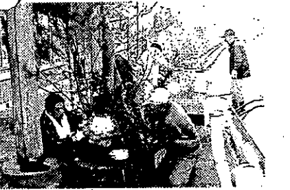
老人クラブの役員の皆さん