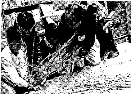
三世代交流会で仲良く

発行：周南市 和田公民館 TEL 0834-67-2069 FAX 0834-67-2169