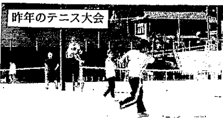
昨年のテニス大会