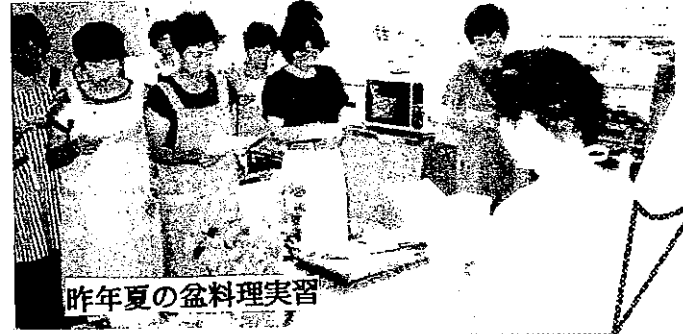
昨年夏の盆料理実習