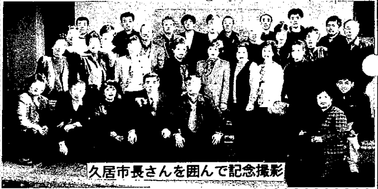
久居市長さんを囲んで記念撮影

和田の里づくり委員会は、新南陽市と友好都市の三重県久居市を訪問し、まちづくりの取組み・福祉施設の見学や地域の皆さんとの交流などを行いました。久居市では、市長さんをはじめ地域の皆さんに、温かく迎えていただき参加者一同有意義な視察研修をすることができました。参加された皆さんお疲れ様でした!!