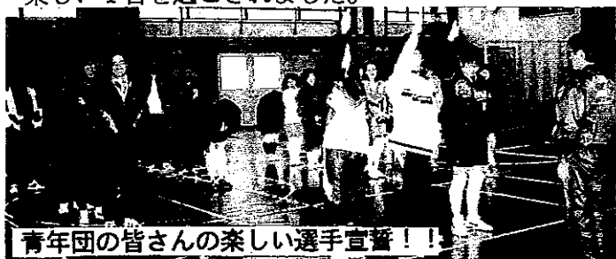
青年団の皆さんの楽しい選手宣誓!!