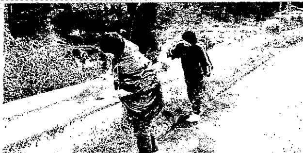
中学校の生徒さんが環境美化活動

お陰さまでたくさんのゴミや缶が回収され、とてもきれいになりました。参加された皆さんお疲れ様でした。