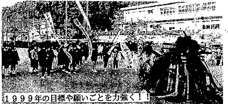
1999年の目標や願いごとを力強く!!