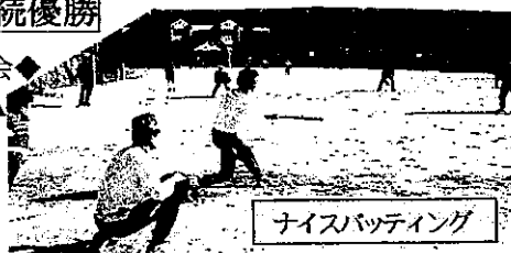
ナイスバッティング