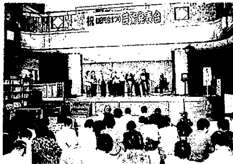
盛り上がった芸能発表会

この和田総合まつりは、地域の皆さんを初め多数の方々にあたたかいご厚志により開催することができ、実行委員一同心より感謝申し上げます。