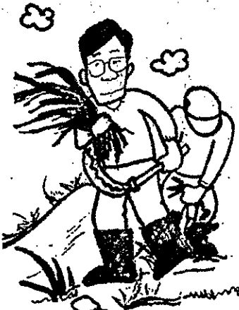
私のアシタはここ