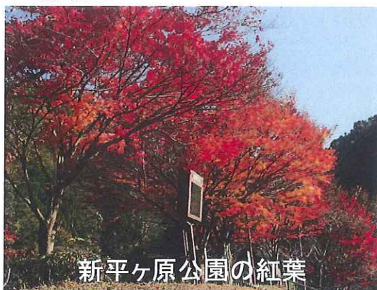
新平ヶ原公園の紅葉

主 催 島地川ダム周辺環境整備地区管理協議会 共 催 和田の里づくり推進協議会 後 援 周南市