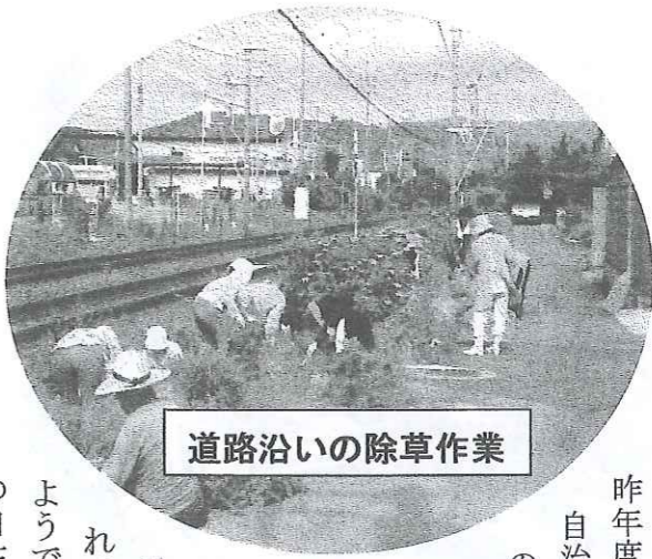
道路沿いの除草作業

初夏を迎え、児童公園や家の周りの空き地では、雑草などが生い茂り、各自治会では、「身近な環境を美しく」健康で住みよい環境づくりのため、ご近所の皆さんが参加して清掃作業に取り組んでおられます。