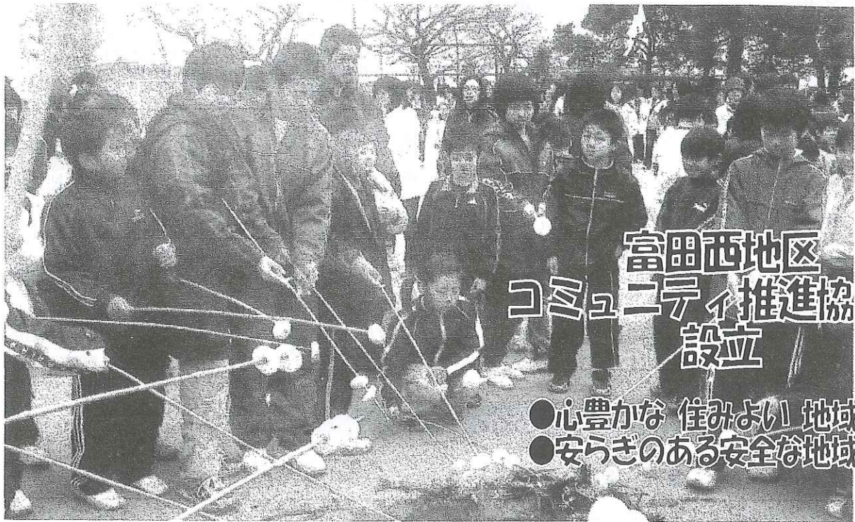
どんど焼き（富田西小学校 1月17日）