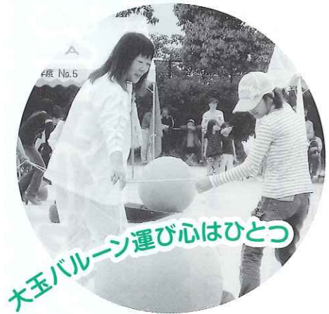
大玉バレーン運び心はひとつ

平成24年5月20日(日)、周南市富田西小学校グラウンドで開かれた。レクリエーション・スポーツ推進委員会と富田西地区コミュニティ推進協議会の共催で「市民のふれあい、まちづくり」を目的に第33回市民運動会を開催、幼稚園児、小学生一般男女までの約1,000人が集いにぎやかに楽しんだ。