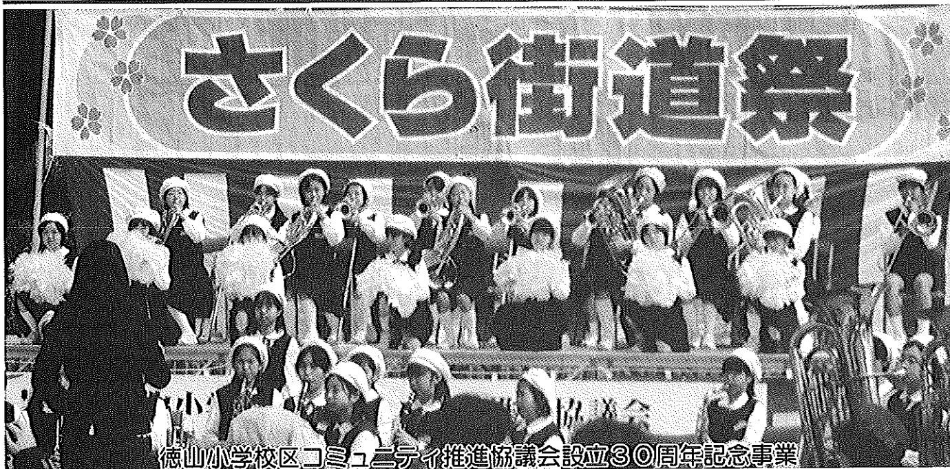
徳山小学校区コミュニティ推進協議会設立30周年記念事業